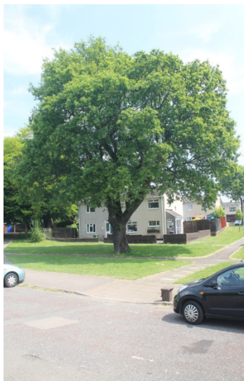
Coeden ar stryd yng Nghwmbrân