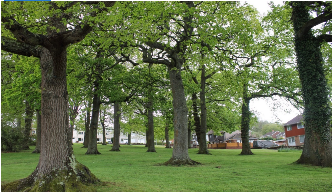
Man gwyrdd trefol yn Nghwmbrân yn dangos coedlun o oed cyfartal gyda gwair wedi ei dorri'n fyr

Mae rhagor o wybodaeth am Orchmynion Cadw Coed ar gael trwy glicio ar y ddolen ganlynol https://llyw.cymru/nodyn-cyngor-technegol-tan-10-gorchmynion-cadw-coed