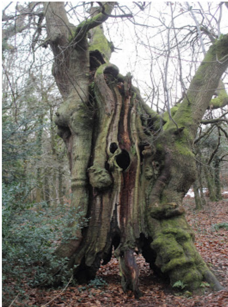
Coeden y Flwyddyn Cymru 2019 ym Mharc Pont-y-pŵl

‘Gwarchod, Cynllunio, Plannu a Rheoli - Tyfu er budd y Genhedlaeth Bresennol a Chenedlaethau’r Dyfodol’