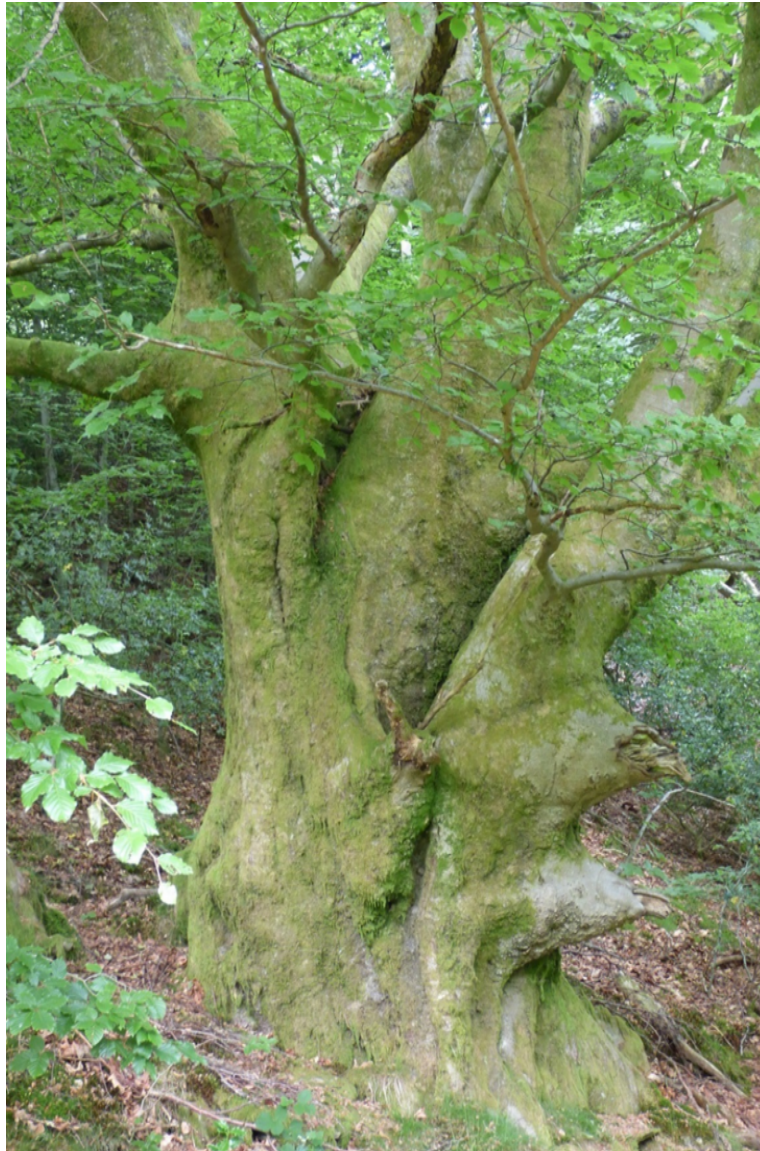
Ffawydden aeddfed yng nghoetir hynafol Cwm-y-Glyn