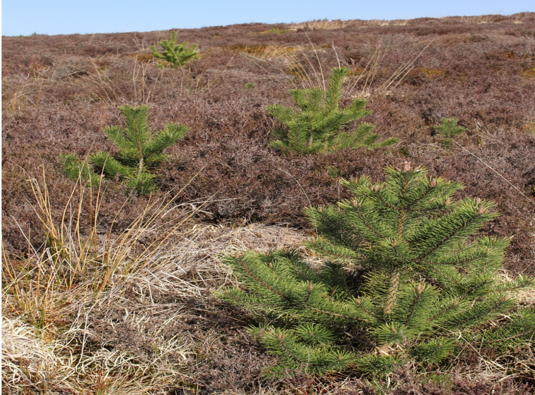
Pinwydden bolion ymwithiol ar ardal Mynydd y Garn-fawr ar Safle o Ddiddordeb Gwyddonol Arbennig Blorens.

3.17.1 Bydd y gwaith o weithredu'r strategaeth hon a'r cynllun gweithredu hwn yn cael ei fonitro a'i adolygu gan Grŵp Cyflawni Swyddogion y Cynllun Bioamrywiaeth a Chadernid Ecosystemau ac adroddir ar gynnydd trwy ofynion adrodd tair blynedd Deddf yr Amgylchedd (Cymru). Bydd y Grŵp yn ymdrechu i sicrhau bod y strategaeth a'r cynllun yn cael eu diweddarau i adlewyrchu unrhyw newidiadau deddfwriaethol neu newidiadau i bolisi sy'n berthnasol.