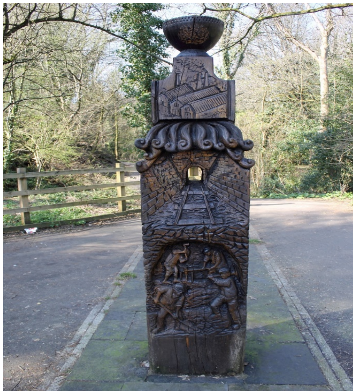
Cerflun ym Mharc Pont-y-pŵl a grëwyd o bren o ffynhonnell leol