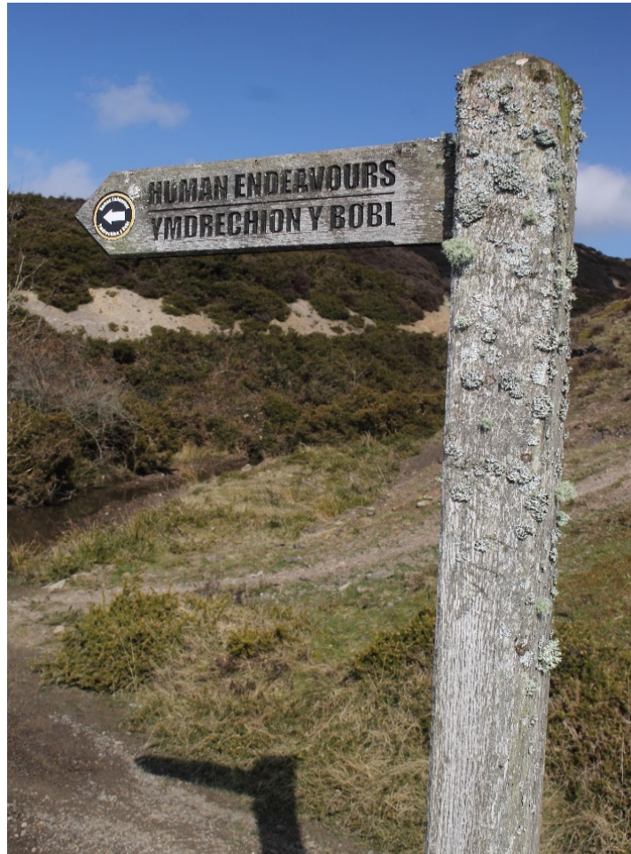
Marciwr ffordd o bren o ffynhonnell gynaliadwy yn Safle Treftadaeth Byd Tirwedd Ddiwydiannol Blaenafon