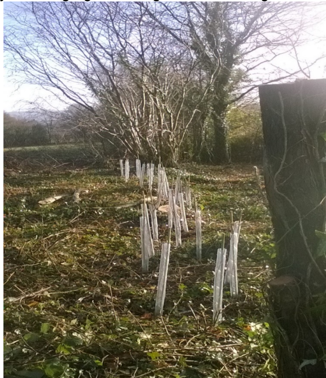
Adfer gwrychoedd ar dir sy'n eiddo i'r cyngor