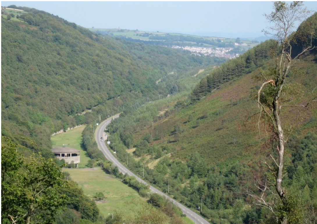
Coetir collddail hynafol a choetir planhigfa goniffer mwy diweddar