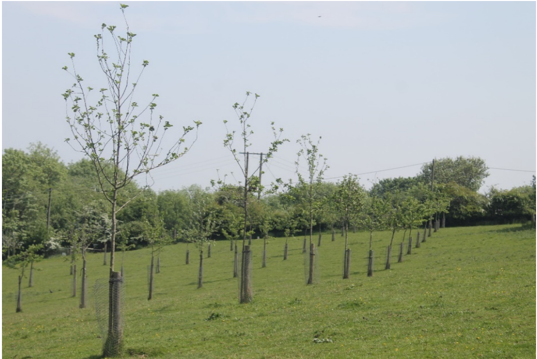
Y Berllan ar Fferm Gymunedol Greenmeadow