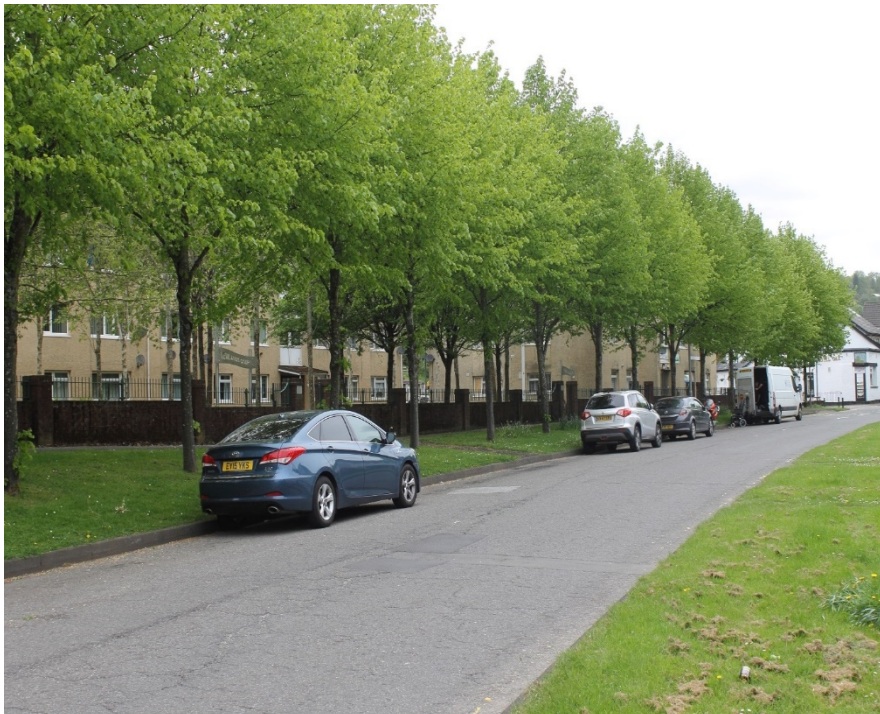
Stryd â choed wedi eu plannu arni ym Mhontnewynydd

https://www.legislation.gov.uk/cy/ukpga/1980/66/contents