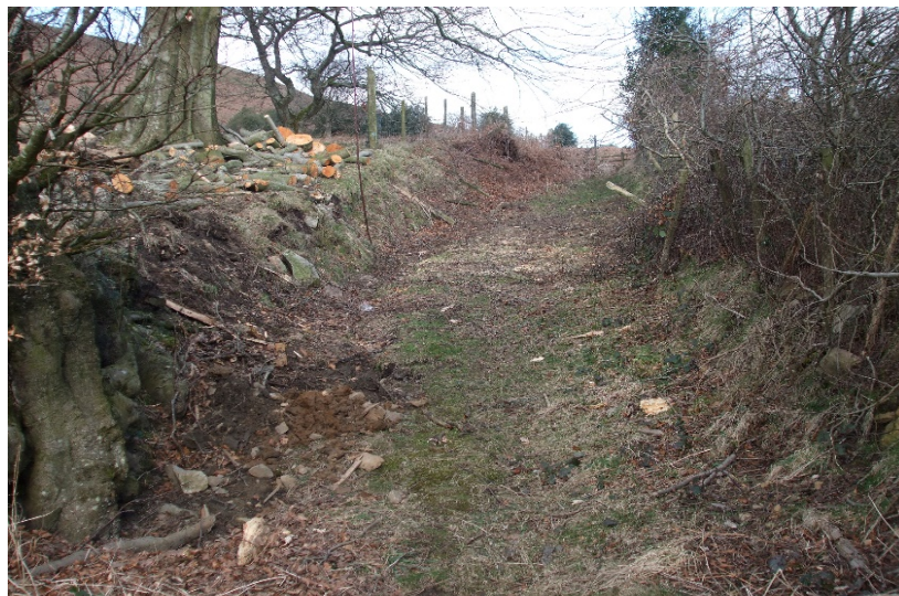
Enghreiffiau o waith ar goed ar Hawliau Tramwy Cyhoeddus