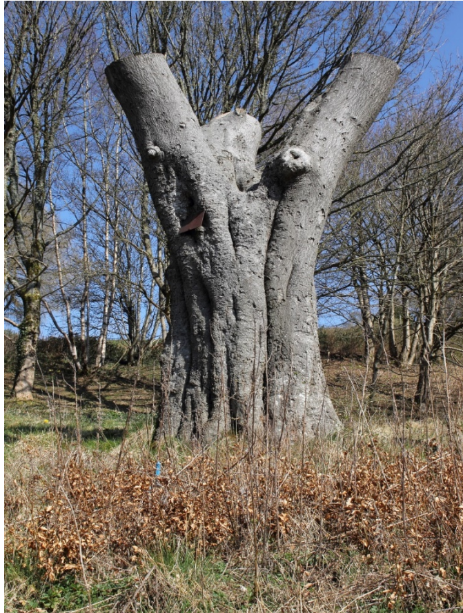
Coeden hynod wedi ei rheoli mewn ffordd gynaliadwy ar ochr y ffordd ym Mlaenafon