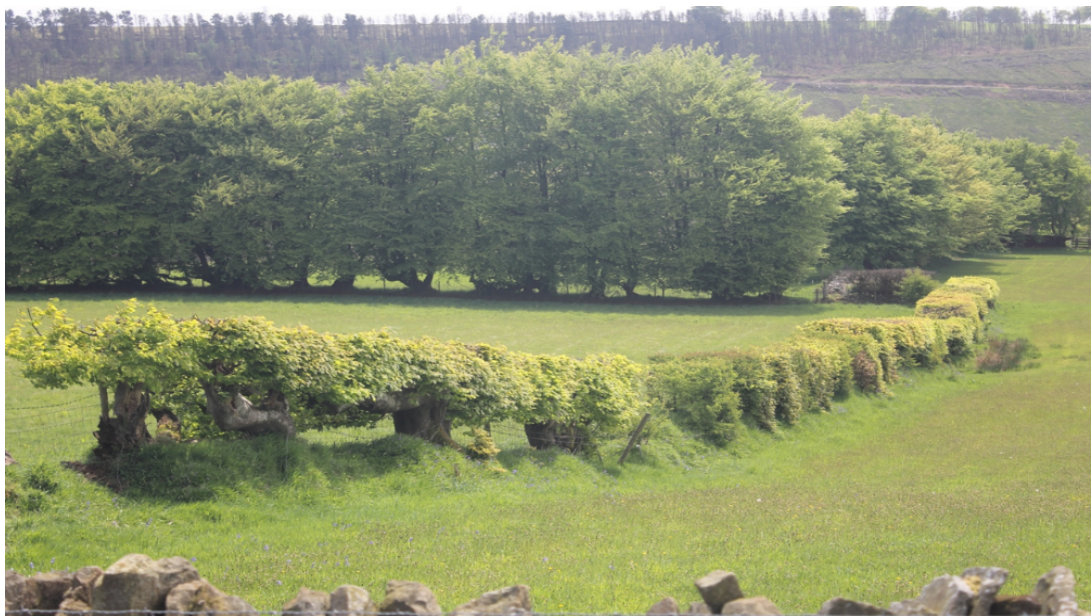
Gwrychoedd ffawydd a reolir ar y blaendir a llinell o goed ffawydd heb eu rheoli yn y cefndir.