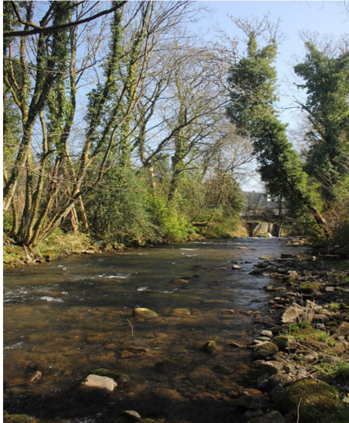
Mae coed yn ychwanegu gwerth at goridau ecolegol strategol fel yr Afon Lwyd