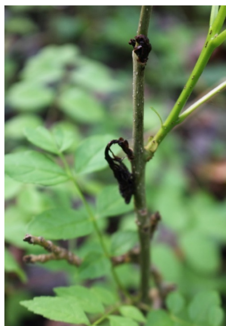
Tystiolaeth o wywo mewn dau lasbren onn ger Abersychan.